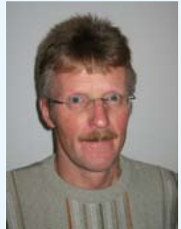
Vitus Monitzer, Bürgermeister

Als Bürgermeister wünsche ich der Veranstaltung einen guten Verlauf, Dank an alle Teilnehmer und vor allem den durchführenden Verein der Sportunion St. Veit - Sektion Langlauf mit allen Helfern.