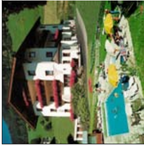
Ferienwohnungen - Appartements Dietmar Hafele